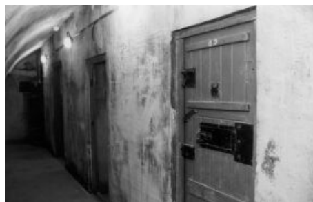
5. ábra Andrassy út 60. cellasor

1946 ősztől, a Belügyminisztérium Államvédelmi Osztályának (BM ÁVO) megalakulását követően rendeletben szabályozták, hogy a népbíróságok által felmentett személyeket vissza kellett kísérni az Államvédelmi Osztályra, amely internálhatta őket, kvázi mint „harmadfokú” fórumként működött, a „népbíráskodás kommunista bírálataát képviselve”. 5