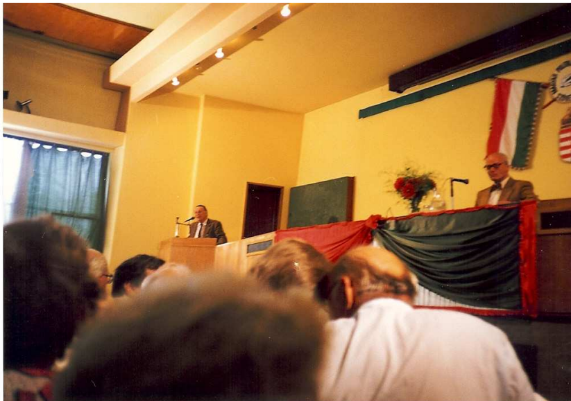
3. ábra Alakuló gyűlés

Mondhatom, hogy a következő évben mindannyiunk figyelmét inkább ez kötötte le. Rá kellett döbbernünk azonban, hogy a Rákosi – korszak politikai elítélteit, a nemzeti ellenállás áldozatait a gomba módra szaporodó szabadságharcos és forradalmár szervezet valójában nem képviseli. Mi 56 előtti elítéltek kimaradtunk a különböző bizottságokból, első nekirugaszkodásban a semmisségi törvényből, szinte mindent utólag kellett kiterjeszteni, mert a gondolkozás és a ideológia 56 forradalmi jellegével, nem pedig a szabadságharc tényével foglalkozott.