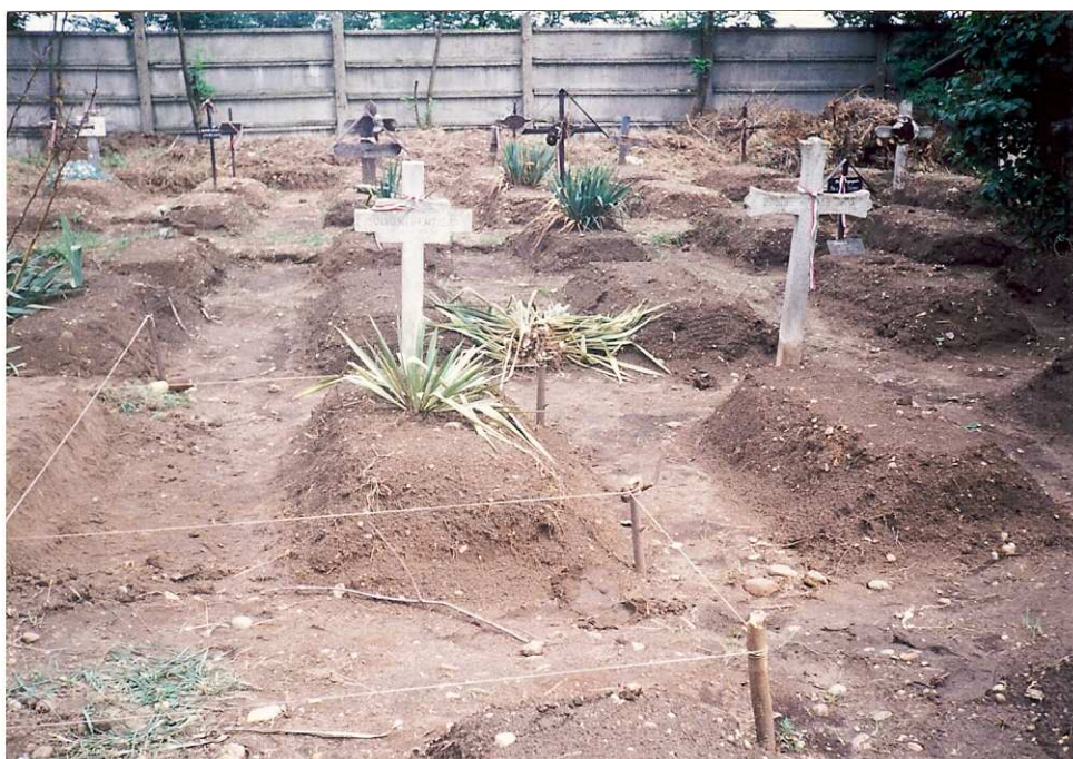
1. ábra A 298-as parcella