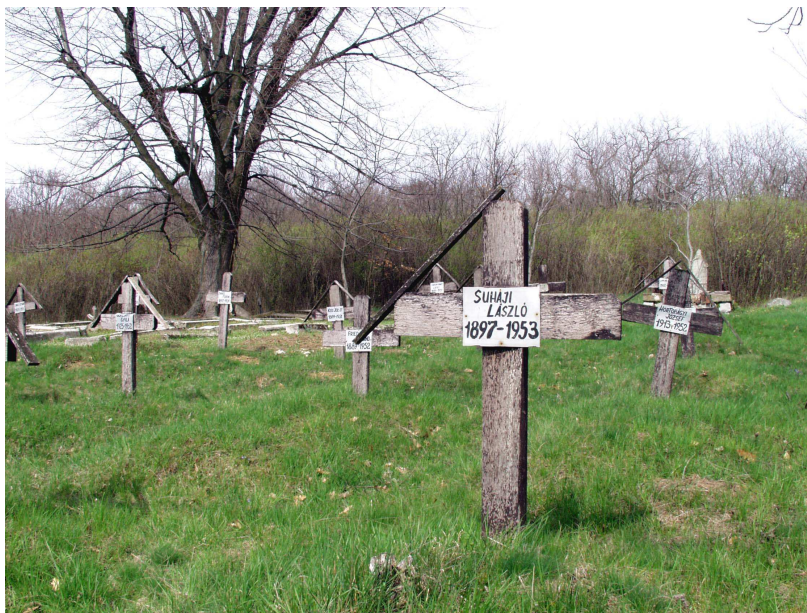
6. ábra Márianosztra rabtemető

Az 1945-56. közötti magyar Politikai Elítéltek Közösségének ERTEŚÍTŐJE