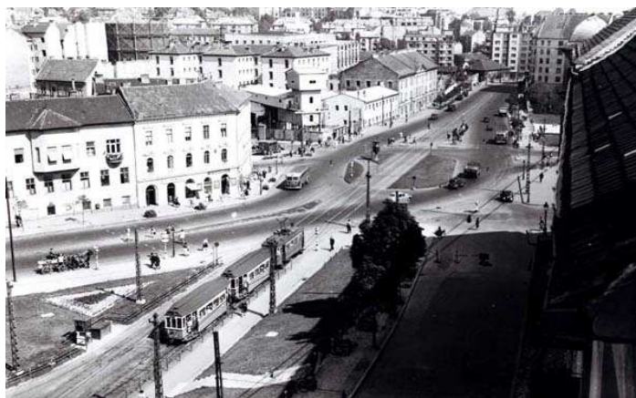
4. ábra A Széna tér és a Margit körüli fegyház 1950-es évek

1945. szeptemberében, az 1945: VII. tc-t, a népbíróságokról elfogadta a parlament. A 25 - melyből 24 működött – népbíróság és ezek több, kihelyezett tanácsa, fokozatosan szűnt meg. 3