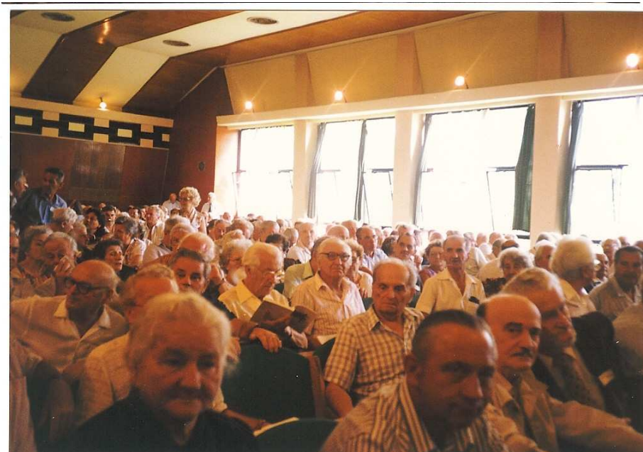
2. ábra Alakuló gyűlés